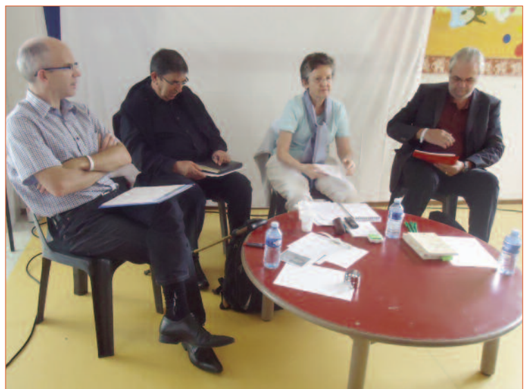
les intervenants de l'atelier sur l'euthanasie