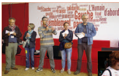
lancement de la campagne des cartes-pétitions