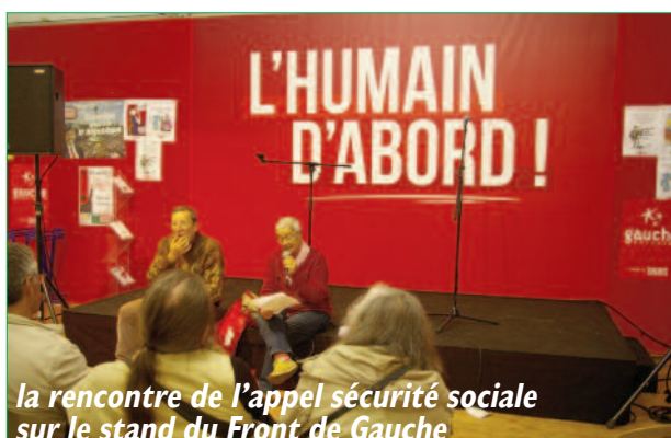
la rencontre de l'appel sécurité sociale sur le stand du Front de Gauche