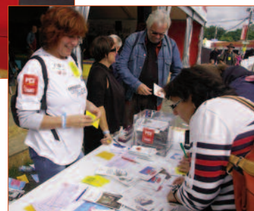
on signe la carte-pétition pour la retraite à 60 ans