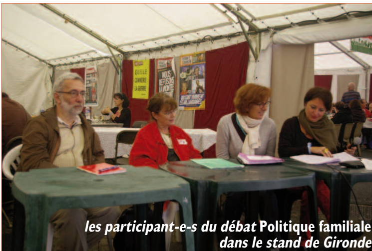
les participant-e-s du débat Politique familiale dans le stand de Gironde