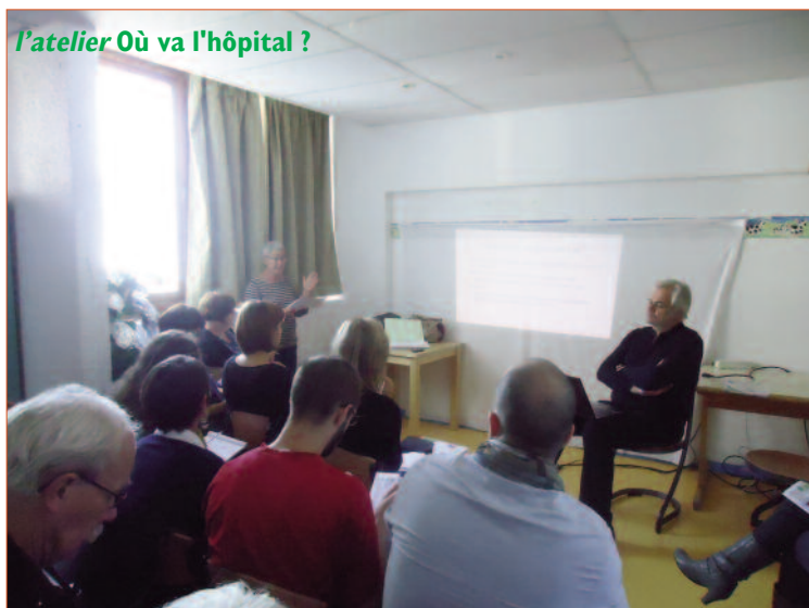
l'atelier Où va l'hôpital ?