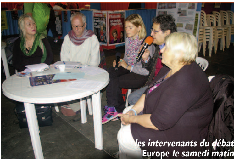
les intervenants du débat Europe le samedi matin

commission Santé/protection nationale du PCF